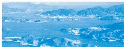
【美しい多島美の瀬戸内海】 筆影山 竜王山 晴れた日には四国山地が遠望でき、しまなみ海道の10橋のうち7つの橋を見ることが出来ます。