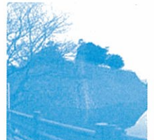
【三原城】 毛利元就の三男 小早川隆景により、永禄10年(1567年)に築城された城です。