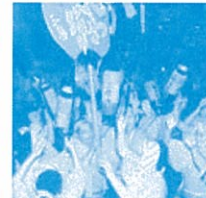
【三原やっさ祭り(8月)】 昭和51年から開催し、動員数約30万人の大きな祭りです。